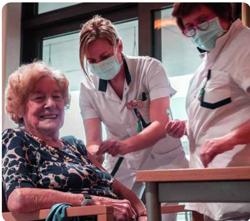
Eerste Bilzerse vaccinaties in Demerhof op 15 januari 2021

Weet jij als kind nog die 'prikjes' die we regelmatig kregen? We wisten het dagen op voorhand en het hield ons danig bezig. Velen hadden er schrik van en anderen hielden zich groot. Achteraf konden we er opgelucht om lachen met elkaar; het viel wel mee.