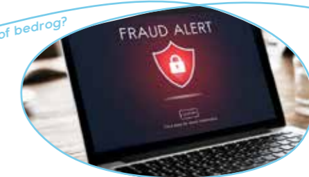
Internet, reclame of bedrog?

informatiesessie - op dinsdag 12 januari 2021 van 13.30 tot 16 uur waar: LDC De Wijzer prijs: 3 euro (5 euro voor niet-Bilzenaren)